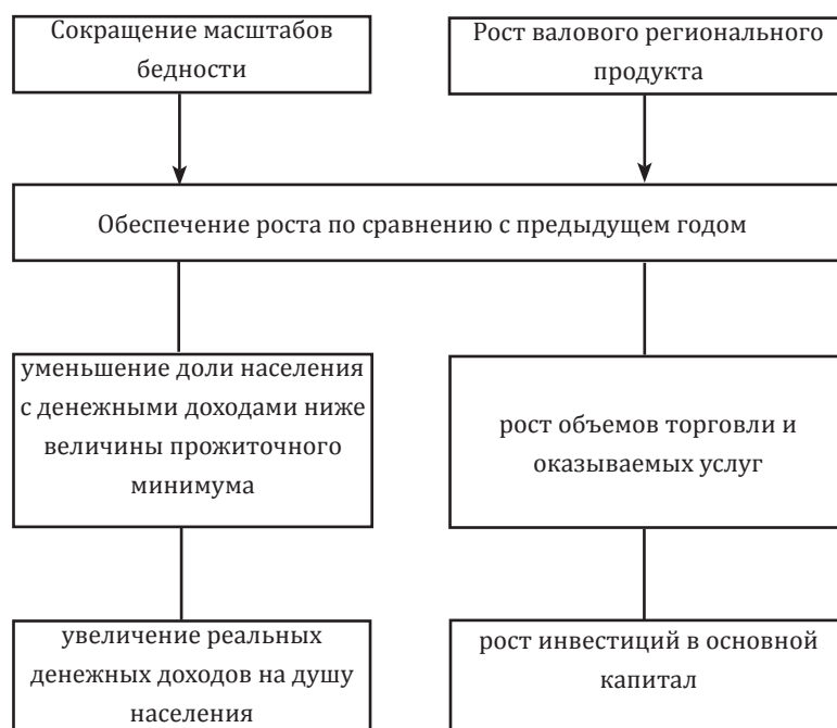
Рис. 2. Обеспечение факторов роста в результате реализации концепции стратегии регионального развития (схематический состав, основные экономические показатели)

меняющихся политических ориентиров и полученных промежуточных результатов. Общие цели одновременно служат критерием развития, ориентиром для действия